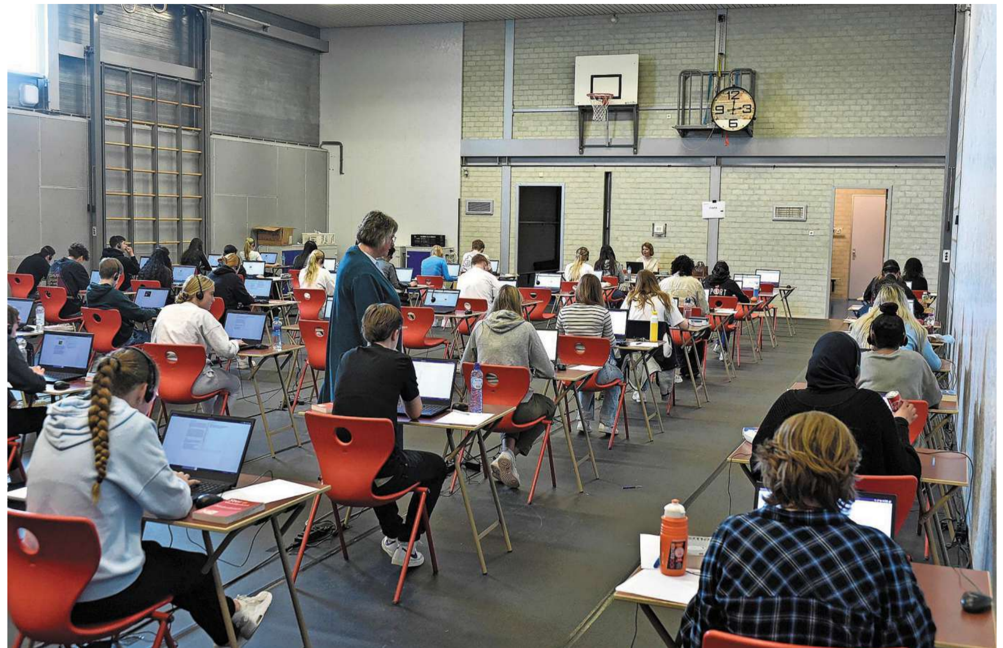
„Ik denk dat ik wel een zesje heb.”